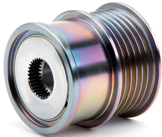
Photo 1 : 535 0279 10 – Poulie à roue libre d'alternateur INA, nouvelle version

Références OE : 04E 903 201 04E 903 201 A 04E 903 201 E 8V0 903 119 8V0 903 119 A