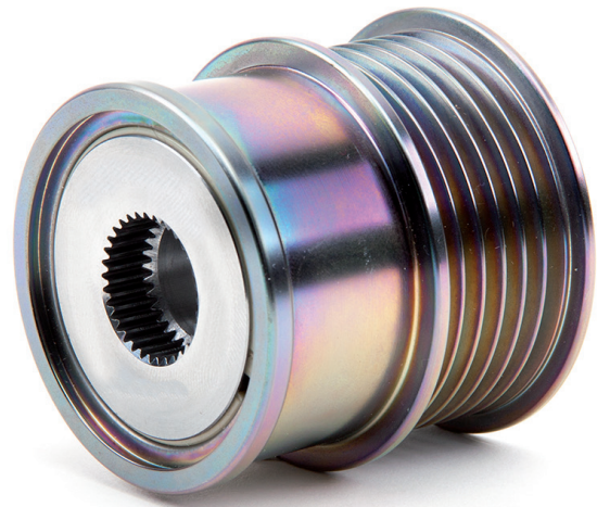
Bild 1: 535 0279 10 – INA-Generatorfreilauf

OE-Nummern: 04E 903 201 04E 903 201 A 04E 903 201 E 8V0 903 119 8V0 903 119 A