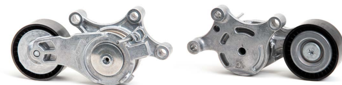
Рисунок 2: Новая конструкция

Как следствие непрекращающейся работы по улучшению нашей продукции, были произведены модификации натяжного ролика 534 0075 20.