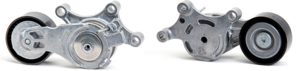
Resim 2: Yeni tasarım

Ürünlerimizi geliştirmeye yönelik çalışmalarımızın bir parçası olarak, 534 0075 20 parça numaralı kayış gergisinde değişiklikler yapılmıştır.