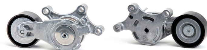
Fig. 2: Nieuwe uitvoering

Als gevolg van de voortdurende verdere ontwikkeling van onze producten is de riemspanner met artikelnummer 534 0075 20 gewijzigd.