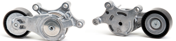
Kuva 2: Uusi versio

Tuotteidemme jatkuvan kehityksen puitteissa modifioitiin laturin vapaapyörä tilausnumerolla 534 0075 20.