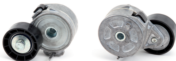
Figura 1: Versione precedente