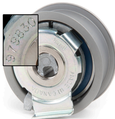
Зображення 2: 531 0851 10 – Новий натяжний ролик (979830)

Дотримуйтеся рекомендацій виробника транспортного засобу!