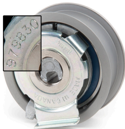
Рисунок 2: 531 0851 10 – новый натяжной ролик (979830)

Соблюдайте рекомендации автопроизводителя!