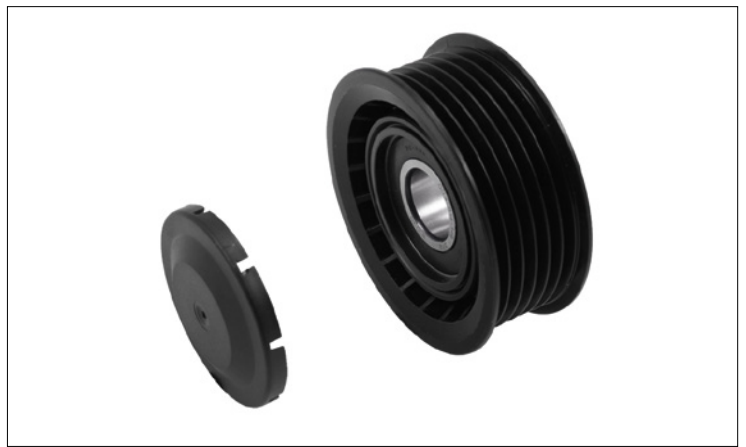
Figura 1: Modelo 1

La principal diferencia es el revestimiento delantero y la arandela adicional en el modelo de la figura 2. En este modelo, para que pueda alinearse la polea acanalada, debe montarse obligatoriamente la arandela suministrada entre el bloque de motor y la polea de inversión.