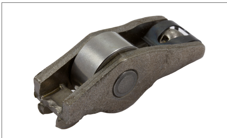
Slika 2: Izvedba 2

Osnovni ukrep je, da vse nihajne ročice v motorju zamenjate hkrati. Za preprečevanje večkratnih popravil in nepotrebnih stroškov je prav tako priporočljivo, da skupaj z nihajno ročico menjate tudi element za izravnavo zračnosti ventilov.