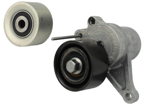
Зображення 1: Металеві натяжний та обвідний ролики

82 00 725 951 (обвідний ролик з пластмаси) 11 75 075 68R (натяжний ролик з пластмаси) 82 01 003 525 (обвідний ролик з металу) 11 75 009 69R (натяжний ролик з металу)