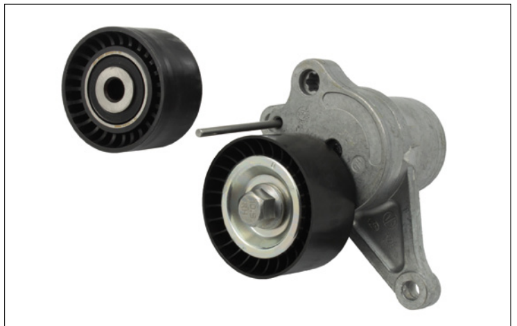
Figura 2: tensionatore e puleggia di rinvio in plastica

Per questi modelli, Schaeffler Automotive Aftermarket offre tensionatori e pulegge di rinvio in plastica (figura 2), che soddisfano al 100% tutti i requisiti tecnici e che possono essere montati su qualsiasi veicolo senza problemi.