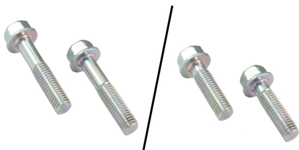
Figur 4: Venstre, tidligere M8x40 mm skruer. Høyre, nye M8x30 mm skruer.

Det er viktig at de medfølgende skruene brukes ved montering av den modifiserte spennarmen.