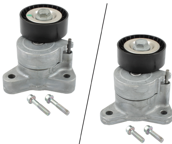
Figur 1: Spennarm 534 0325 10 – Venstre, tidligere versjon med festeskruer. Høyre, ny versjon med festeskruer.

Som en del av den kontinuerlige utviklingen av våre produkter, har det blitt gjort endringer til spennarmen 534 0325 10.