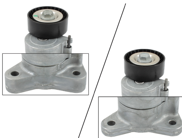
Figur 3: Venstre, tidligere versjon med brede festepunkter. Høyre, ny versjon med smale festepunkter.

Merk deg kjøretøyproduzentens spesifikasjoner!