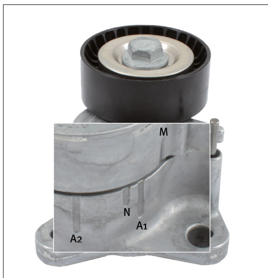
Slika 2: Poboľjšane oznake na radnoj površini ramena natezača.

Imajte na umu da su isporučeni pričvrtni vijci kraći da bi se mogla ugraditi tanja pričvrtna prirubnica.