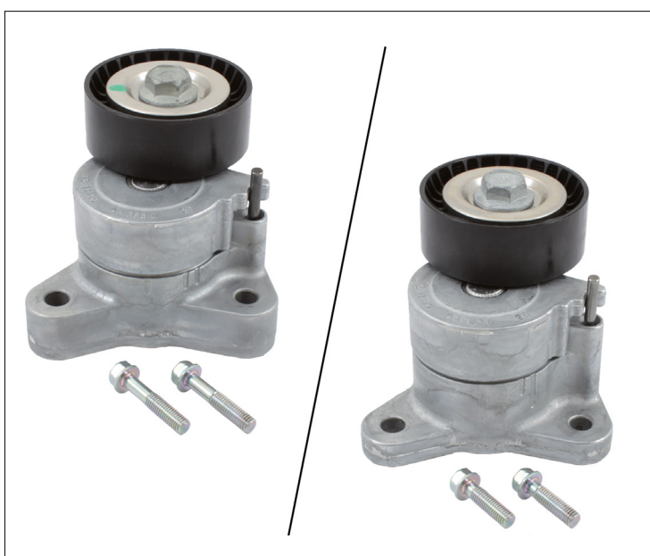
Slika 1: Rame natezača Kat.Br. 534 0325 10 – Lijevo, stara izvedba sa pričvrsnim vijcima. Desno, nova izvedba sa pričvrsnim vijcima.

Kao dio stalnog usavršavanja svojih proizvoda, izvršene su preinake na nateznom ramenu Kat.Br. 534 0325 10.