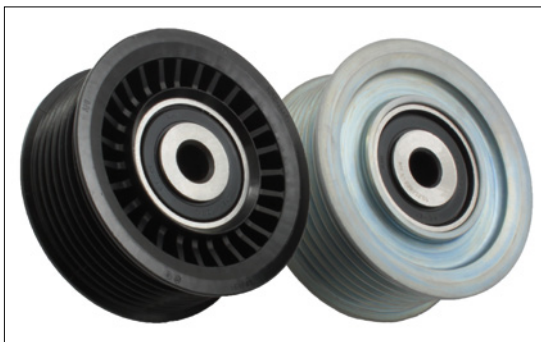
Figura 1: entrambe le versioni della puleggia di rinvio

Nel comando dei gruppi accessori dei modelli sopra indicati, Renault monta due tipi diversi di pulegge di rinvio (figura 1). I veicoli possono essere provvisti di una puleggia di rinvio in plastica o in metallo.