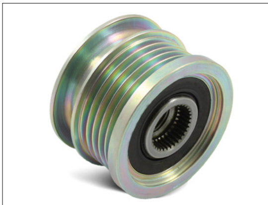
Fig. 2: Dynamorijlooprool 535 0143 10

Hevige trillingen van de multiriem kunnen bij de bovengenoemde voertuigen met starre dynamorol veel lawaai produceren.