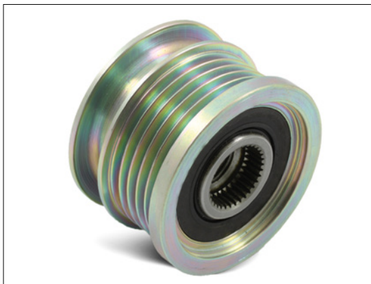
Figura 2: Ruota libera alternatore 535 0143 10

Schaeffler Automotive Aftermarket ha predisposto per questi veicoli una ruota libera alternatore come soluzione tecnica. La ruota consente di attenuare le sollecitazioni dinamiche nel comando dei gruppi accessori prevenendo quindi la formazione di rumori.