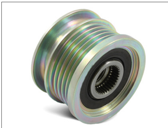
Figura 2: Polea libre del alternador 535 0143 10

Como solución técnica, Schaeffler Automotive Aftermarket ofrece para estos vehículos una polea libre de alternador. Esta polea reduce las cargas dinámicas en la transmisión del grupo auxiliar y evita, de este modo, que se produzcan ruidos.