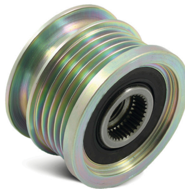
Billede 2: Friløbsremskive 535 0143 10

Som en teknisk løsning tilbyder Schaeffler Automotive Aftermarket et friløbshjul til generator i disse køretøjer. Dette reducerer de dynamiske belastninger i tilbehørsenhedsdrevet, så støjemission forhindres.