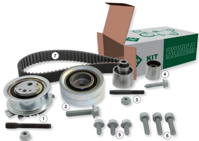
画像1：INA テンショナープーリーキット 530 0550 10

タイミングアセンブリのすべての部品は、同じサービス寿命を実現するように設計されており、受ける摩耗量も同じです。