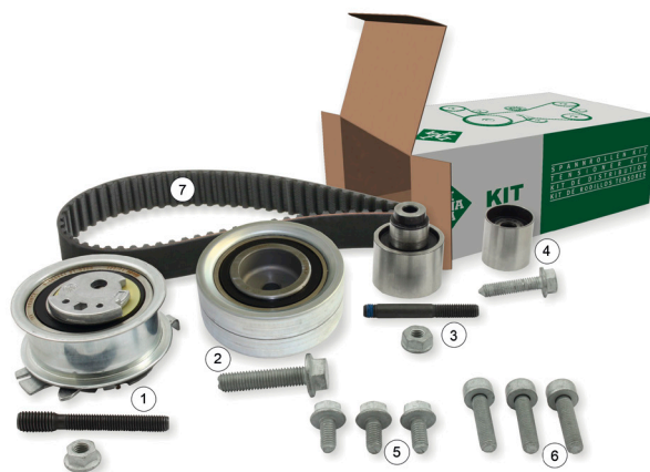
1. ábra: INA feszítőgörgő-készlet 530 0550 10

A vezérlés meghajtásának minden komponensét azonos élettartamra méretezték és együttes kopásnak vannak kitéve.