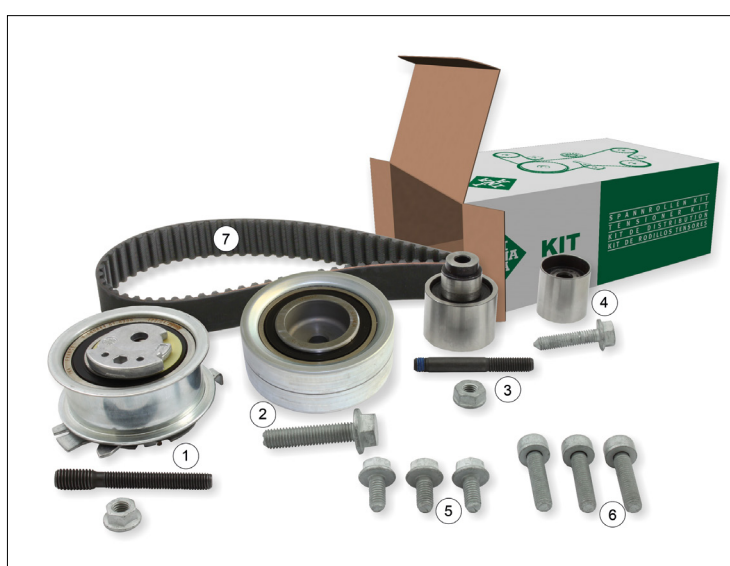
Slika 1: Kat. Br. 530 0550 10 INA Kit natezne remenice