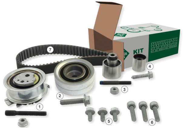
Kuva 1: INA hihnasarja 530 0550 10

Jakopään hihnavetojärjestelmän kaikki komponentit ovat suunniteltu kestävämmän, mutta myös kulumaan säädetyn vaihtovälän puitteissa.