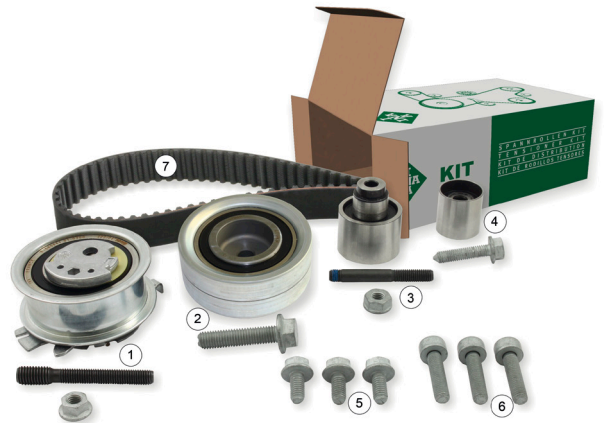
Εικόνα 1: Τροχαλία τάνσης INA Kit 530 0550 10

*Set = δεν περιλαμβάνεται ο ιμάντας χρονισμού