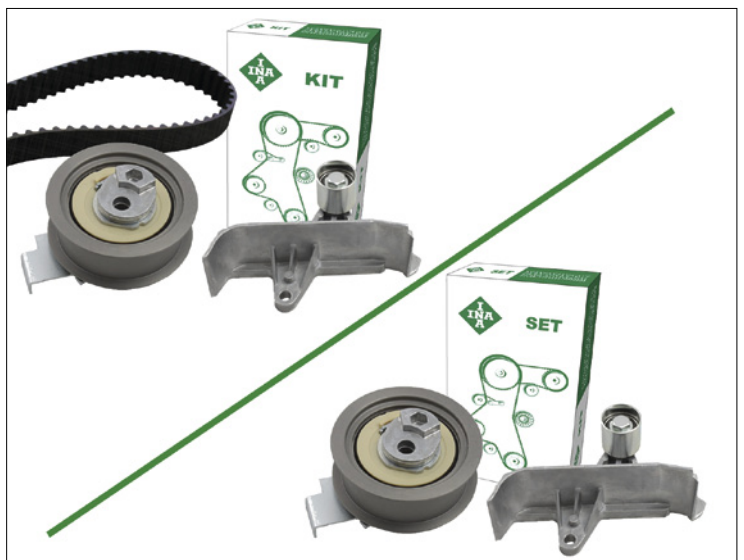
Figura 2: a sinistra KIT 530 0546 10, a destra Set 530 0546 09

Non è consentito il montaggio misto, poiché i rispettivi componenti sono tarati l'uno sull'altro e garantiscono solo quando usati assieme la corretta tensione della cinghia.