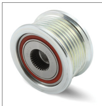
Figura 1: Versione precedente

Produttore: Toyota Modello: Hilux, Fortuner Motore: 2.5 D-4D, 3.0 D4-D N. art.: 535 0128 10 Riferimento OE: 27415-0L040