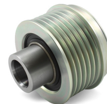
Billede 4: Ny udførelse

Som en del af vores fortløbende indsats for at forbedre vores produkter, er der blevet foretaget ændringer på friløbsremskiven med reservedelsnummer 535 0233 10.