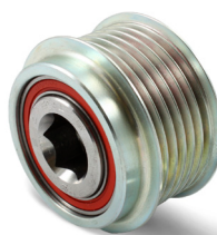
Billede 1: Nuværende udførelse