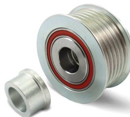
Billede 3: Nuværende udførelse