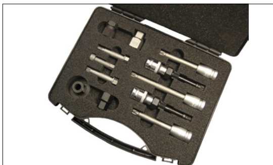
Photo 3: Outillage spécial INA réf. 400 0241 10

La pose et la dépose de la poulie à roue libre d'alternateur exigent l'utilisation d'un outillage spécial (photo 3).