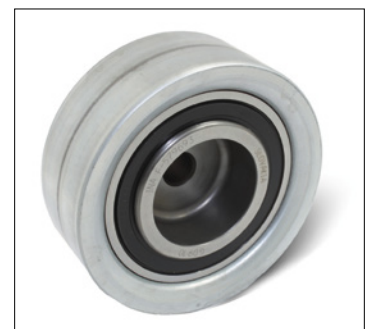
Fig. 2: Nieuwe uitvoering van plaatstaal

In het kader van de voortdurende verdere ontwikkeling van onze producten is het loopvlak van de geleiderol 532 0111 10 gewijzigd van sintermetaal in plaatstaal.