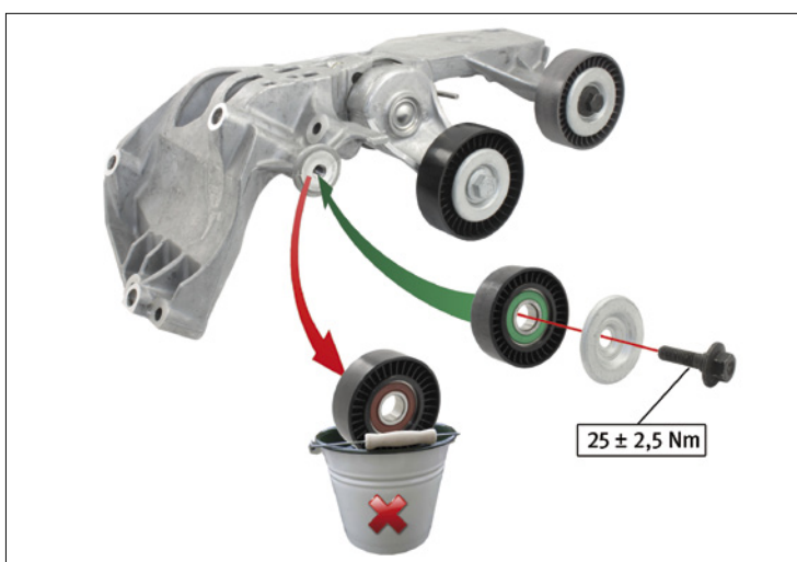
Figura 1: Unità tensionatrice 534 0243 10

Costruttore: Mercedes-Benz Modelli: A 160 CDI (168.007) fino a VIN J568589 A 170 CDI (168.008) fino a VIN J568589 Codici motore: OM 668.940, OM 668.941 N. di art.: 534 0243 10 Riferimento OE: A 166 200 09 70