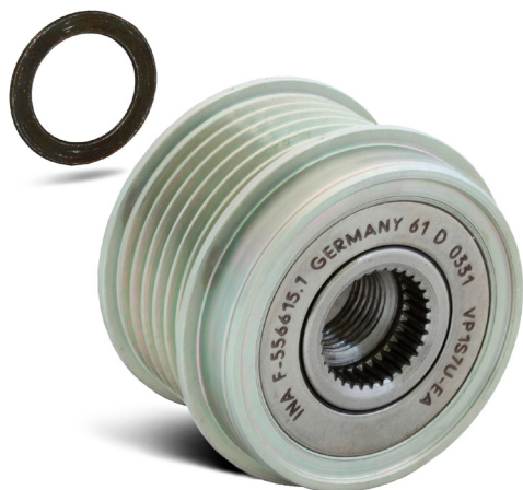
Bild 2: Vid montering av generatorfrinav på växelströmgenerator Bosch skall den medlevererade distansbrickan med tjocklek 1,4 mm användas!

Som teknisk lösning marknadsför Schaeffler Automotive Aftermarket ett generatorfrinav till dessa fordon. Detta minskar den dynamiska belastningen i hjälppaggregatdriften och förhindrar på så sätt uppkomsten av buller.