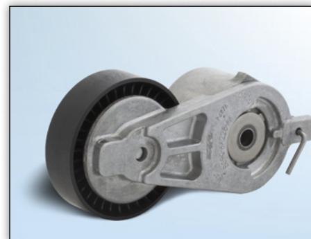
Fig. 2: Versie 2

In de genoemde voertuigen worden in de fabriek twee verschillende versies van de spanarm voor de aggregaataandrijving gemonteerd.