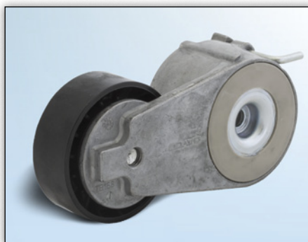
Fig. 1: Versie 1

Fabrikant: Ford Modellen: Galaxy, Mondeo IV, S-Max Motor: 1.8 TDCi OE-nummers: 6G9Q-6A228-BC / 1425510 8G9Q-6A228-AA / 1567809 Artikelnr.: 534 0412 10