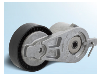
Billede 2: Version 2

I de nævnte køretøjer monterer man ved fremstilling to forskellige strammeenheder til at drive aggregater.