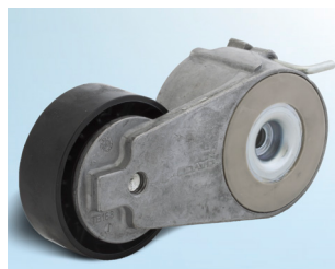
Billede 1: Version 1