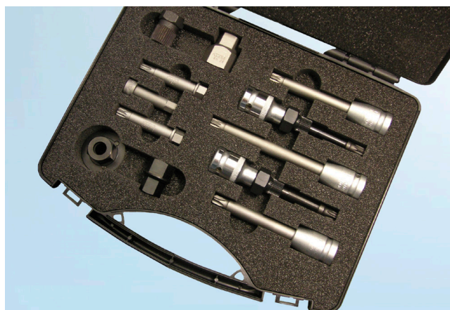
Billede 3: INA- speciellværktøj, Best. nr. 400 0241 10

Schaeffler Automotive Aftermarket tilbyder nu kun et friløbshjul til generator (se figur 2), som kan anvendes i de nævnte modeller af alle tre fabrikanter.