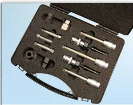
Fig. 3: Herramienta especial INA Número de artículo 400 0241 10

Ambas poleas libres del alternador cumplen con todas las especificaciones técnicas y se diferencian únicamente en el aspecto.