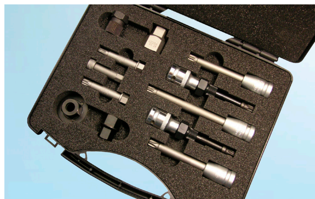
Billede 3: INA- specielværktøj, komponentnr. 400 0241 10