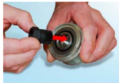
Рис. 3: Соответствующий адаптер вставляется в шкив с обгонной муфтой