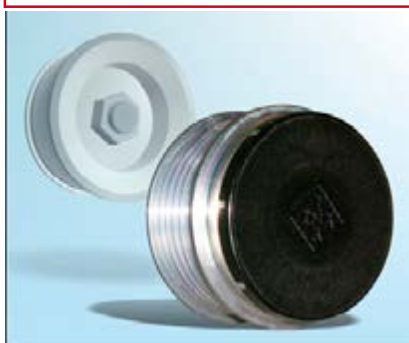
Рис. 2: Защитная крышка должна быть установлена на шкивы OAP и OAD для защиты от грязи

Инструкция по диагностике: Подходящий адаптер должен быть выбран из набора специнструмента при снятии или диагностике шкивов OAP / OAD