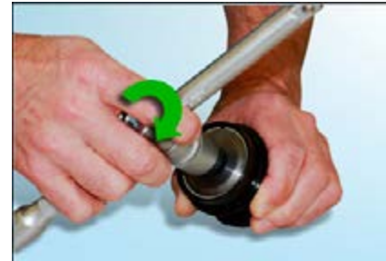
Рис. 6: Вы должны помнить о возвращающей пружинной силе при проворачивании инструмента против часовой стрелки.

Соблюдайте рекомендации автопроизводителя!