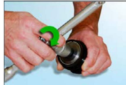
Рис. 6: Вы должны помнить о возвращающей пружинной силе при проворачивании инструмента против часовой стрелки.

Соблюдайте рекомендации автопроизводителя!