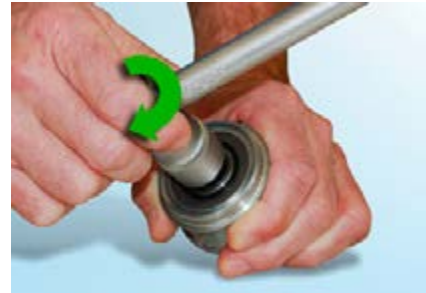
Рис. 5: Инструмент должен проворачиваться по часовой стрелке с легким сопротивлением.