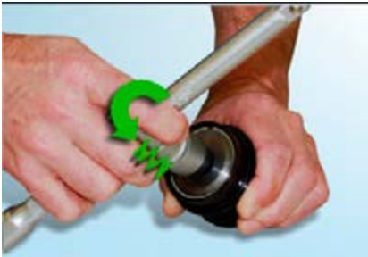
Рис. 6: Вы должны помнить о возвращающей пружинной силе при проворачивании инструмента против часовой стрелки.