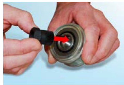
Рис. 3: Соответствующий адаптер вставляется в шкив с обгонной муфтой