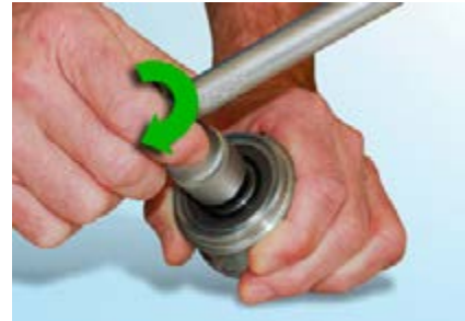
Рис. 5: Инструмент должен проворачиваться по часовой стрелке с легким сопротивлением.