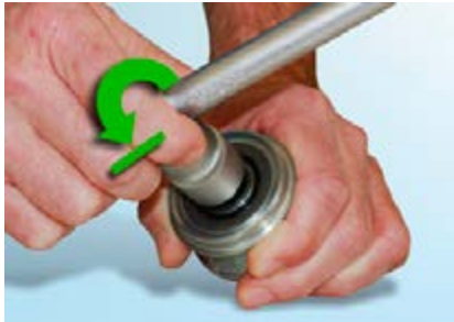
Рис. 4: Инструмент должен надежно блокироваться при повороте его против часовой стрелки.