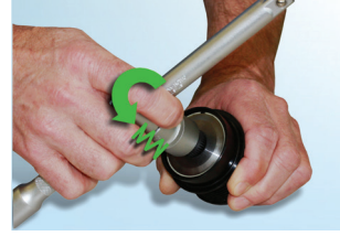
Şekil 6 : Alet saatin tersi yönde hareket ettiğinde artan şiddette bir yay kuvveti hissedeceksiniz.