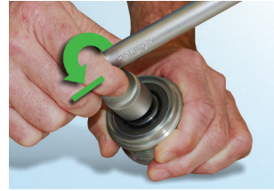
Şekil 4 : Saatin tersi yönde hareket ettiğinde alet anında sıkışır ve dönmez.

Bir devir ayarlı alternatör kasnağının (OAP) testi sırasında dikkat edilmesi gereken özellikler: