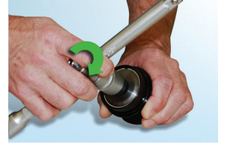
Şekil 7 : Alet düşük bir dirençle saat yönünde sürekli olarak dönebilir.

İlgili parça referanslarını, www.schaeffler.com.tr veya www.rexpert.com.tr adreslerindeki online kataloglarımızdan bulabilirsiniz.