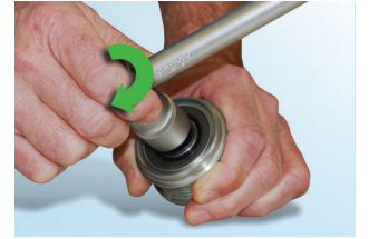
Şekil 5 : Alet düşük bir dirençle saat yönünde sürekli olarak dönebilir.