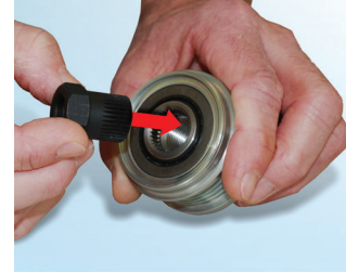
Şekil 3: Doğru anahtar devir ayarlı alternatör kaskağı takılmış.