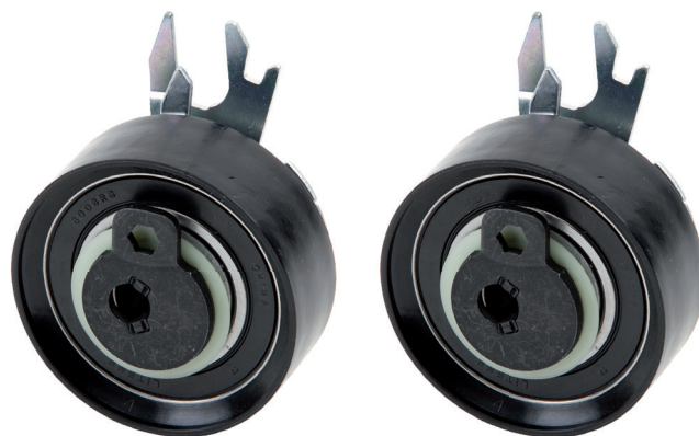
Photo 1 : à gauche - galet tendeur réf. 531 0252 30, à droite - galet tendeur réf. 531 0525 30

Références INA : 531 0252 30 531 0525 30