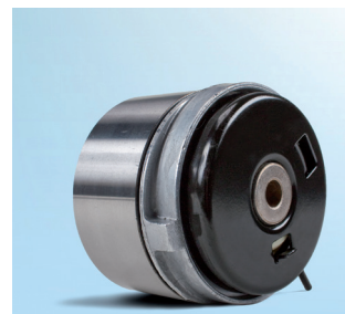
Зображення 4: Нова модель, вигляд ззаду

В рамках постійного вдосконалення нашої продукції було змінено конструкцію натяжного ролика 531 0779 10. Ця технічна інформація показує візуальні відмінності (див. зображення 1–4) обох версій.