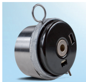
Зображення 3: Попередня модель, вигляд ззаду