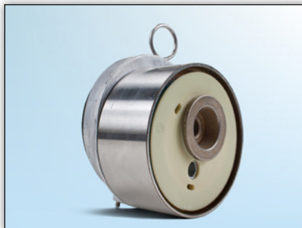
Fig. 1: Vooraanzicht van de huidige uitvoering