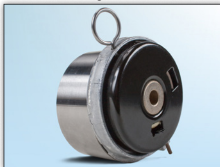
Fig. 3: Achteraanzicht van de huidige uitvoering