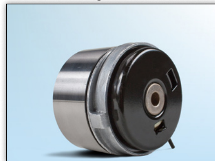
Fig. 4: Achteraanzicht van de nieuwe uitvoering

Als gevolg van de voortdurende verdere ontwikkeling van onze producten is het ontwerp van de spanrol 531 0779 10 gewijzigd. Deze service-info toont de uiterlijke verschillen (zie Fig. 1 t/m 4) van de beide uitvoeringen.