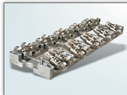
Figura 2: Telaio a bilanciere 423 0063 10

I costruttori di veicoli Citroën, Fiat, Ford, Land Rover e Peugeot hanno introdotto una nuova famiglia di motori diesel conformi alla norma sulle emissioni Euro 4. La caratteristica di questi motori è il telaio a bilanciere in alluminio per la distribuzione (comando a valvole) sviluppato da INA (vedere figure 1 e 2).