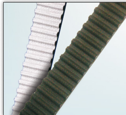
Slika 2: Crna i bijela presvlaka na nazubljenom profilu

Poštujte specifikacije proizvođača vozila!