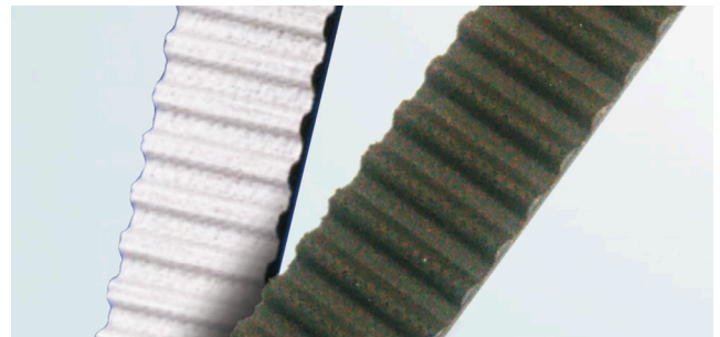
Εικόνα 2: μαύρη και άσπρη επίστρωση στο οδοντωτό προφίλ

πετρελαιοκινητήρες. Αυτή η επίστρωση με Teflon® είναι συνήθως μαύρη ή άσπρη (βλέπε εικόνα 2), χωρίς να επηρεάζει το χρώμα από μόνο του καθόλου τη λειτουργία.