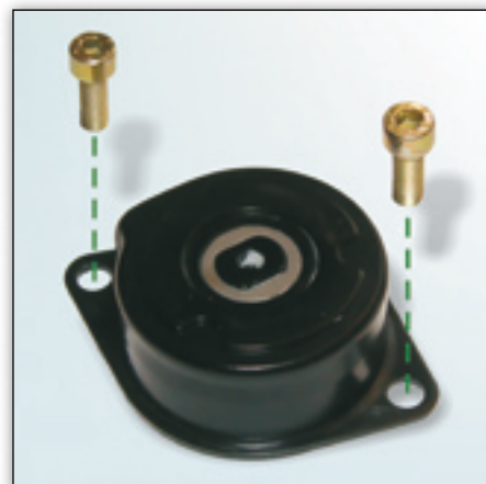
Fig. 2: Uitvoering met twee schroeven M8x22

Bij het vervangen van de riemspanner 533 0086 30 kunnen de getoonde versies in de auto worden gemonteerd.