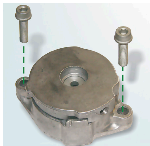
Billede 1: INA – specifikation med to M8x35 skruer