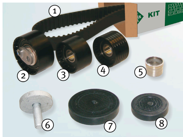
Billede 2: Indhold af KIT 530 0342 10

Billede 2 viser KIT 530 0342 10, som indeholder alle dele nødvendige dele til tandremmens udskiftning: