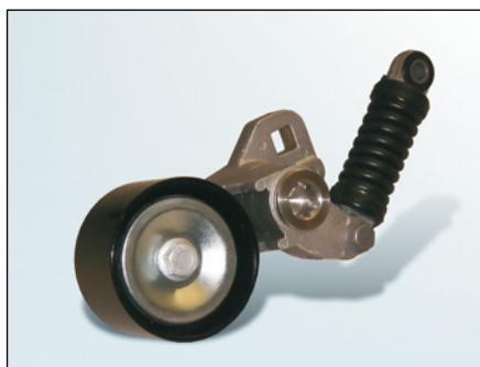
Figura 1 534 0062 20 (versione sostituita)

(1) 534 0062 20 (vecchio) (2) 534 0340 10 (nuovo)