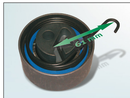
Slika 2: 531 0819 10

Pri menjavi napenjalnega valja s katal. št. 531 0535 20 oz. 531 0819 10 pazite, kateri valj ustreza kateremu vozilu.